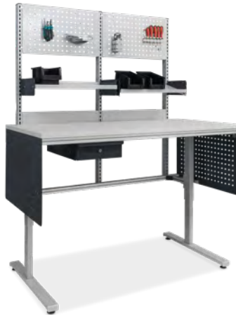
Montagetisch mit hohem Aufbau für Ablageboden und Lochblech, inkl. Einzelschublade und seitlichem Klemmschutz