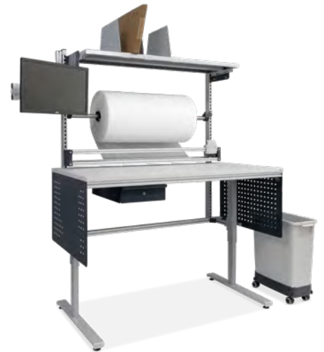
Packtisch mit hohem Aufbau, Schneidevorrichtung, Ablage für Kartonagen und Schwenkarm für Bildschirm